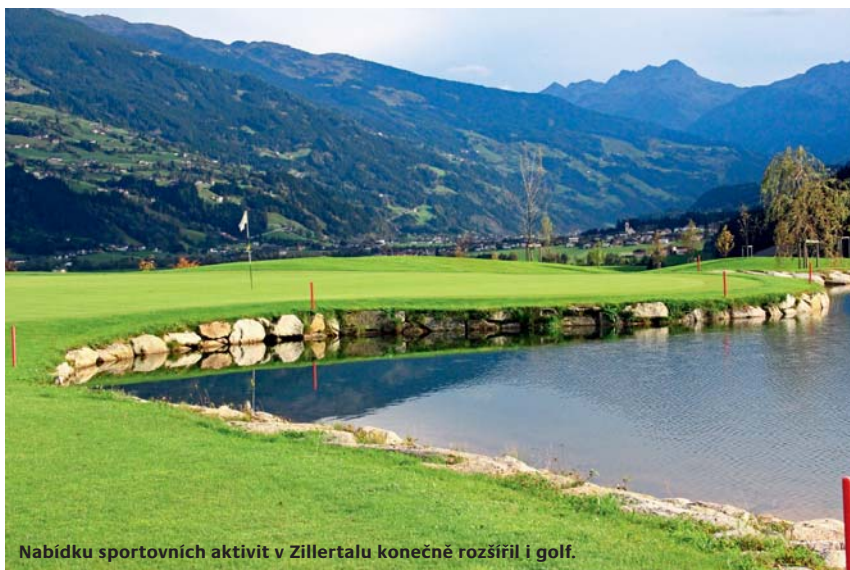
Nabídku sportovních aktivit v Zillertalu konečně rozšířil i golf.

a 25 zaměstnanci. Postupně přibývalo lidí, možností, jak si v hotelu užívat, i zaměstnanců. Na přelomu tisíciletí už museli stavět druhý dům pro zaměstnance včetně sauny, fitness a lyžařny. 100 zaměstnanců, 4 000 m 2 wellness, 185 postelí.